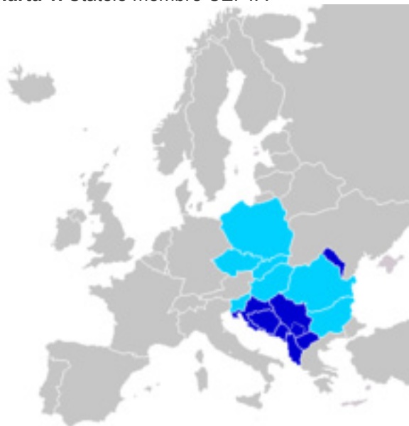
Harta 1. Statele membre CEFTA*